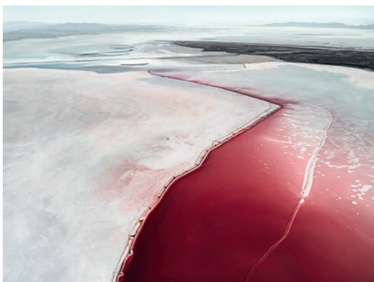
"Aus der Salt Series III" – 2021