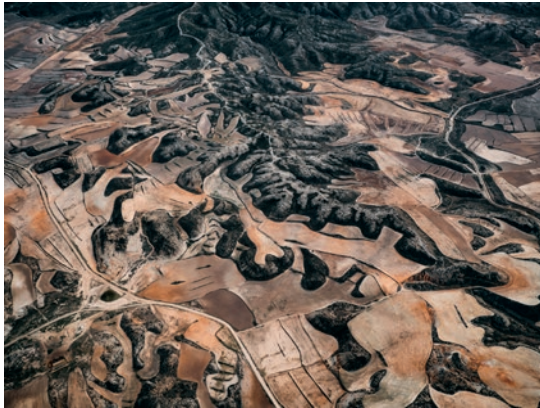
"Aus der Spanish Farmland Series" – 2019