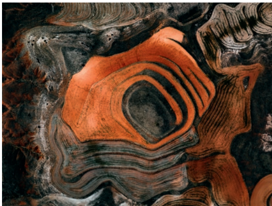
"Aus der Spanish Farmland Series" – 2019