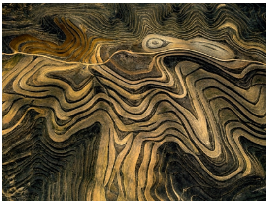
"Aus der Spanish Farmland Series" – 2019