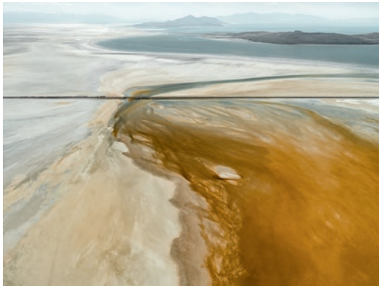
"Aus der Salt Series III" – 2021

Die Bilder dürfen weder beschnitten noch retuschiert werden. Bilddateien müssen aus den Archiven nach Gebrauch entfernt werden.